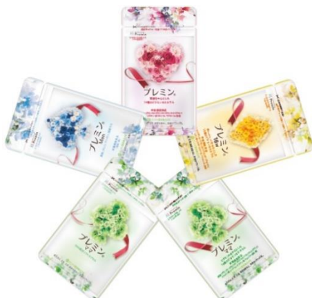
時期別の葉酸サプリメント『プレミン』シリーズ

当社は、「妊活準備から妊娠 15w あたり」「妊娠 16w あたりから出産まで」「産後授乳時」という 3 つのステージに分けた時期別葉酸サプリ『プレミン』シリーズを販売しています。古来より妊娠期間を表す「十月十日（とつきとおか）」にならい、2018 年より 10 月 10 日が「プレミンの日」として一般社団法人 日本記念日協会に登録されたことを記念し、夫婦にまつわるユニークな川柳を募集する企画です。季節や時流に合ったテーマで、毎奇数月に募集、翌偶数月に発表しています。