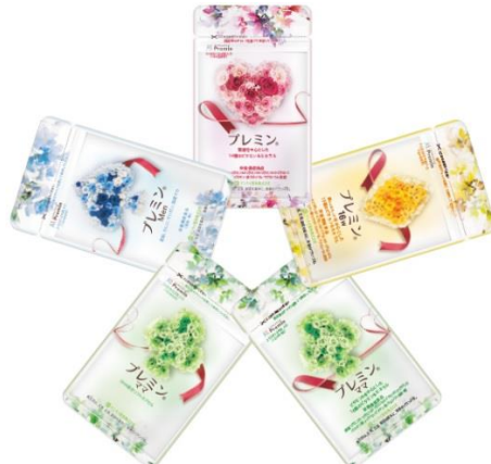
時期別の葉酸サプリメント『プレミン』シリーズ

当社は、「妊活準備から妊娠 15w あたり」「妊娠 16w あたりから出産まで」「産後授乳時」という 3 つのステージに分けた時期別葉酸サプリ『プレミン』シリーズを販売しています。古来より妊娠期間を表す「十月十日 (とつきとおか)」にならい、2018 年より 10 月 10 日が「プレミンの日」として一般社団法人 日本記念日協会に登録されたことを記念し、夫婦にまつわるユニークな川柳を募集する企画です。季節や時流に合ったテーマで、毎奇数月に募集、翌偶数月に発表しています。