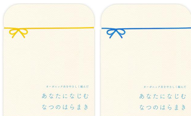
パッケージのリボンは夏をイメージした黄と青の2種

時期別の葉酸サプリの販売を行うゲンナイ製薬株式会社（本社：東京都千代田区、代表取締役社長：上山永生）は、オーガニックコットンを使用した薄手の夏用腹巻き『あなたになじむ なつのはらまき』を2019年6月1日に発売します。3月に発売した春用腹巻きが好評だったことによるシリーズ化で、春用より約25%薄く編み込み、暑すぎることなく冷房などの夏冷えからおなかを守ります。