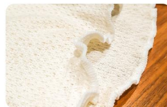
体を締め付けないフリル状のふち

当社は、3月に春用の腹巻き『あなたになじむ はるのはらまき』を販売開始しました。腹巻き＝冬のアイテム、というイメージがありますが、妊活中・妊娠中のお客さまの「季節に関係なく、おなかはいつも温めておきたい」という声から、寒暖差の激しい春の冷え対策のために誕生した製品です。この春用腹巻きは、一時的に品切れになるほど好評だったため、冷房の効きすぎなどで夏冷えの悩みが増える夏にも需要があるととらえ、春用と比べ約25%薄く仕上げた暑くない夏用腹巻きを発売することになりました。