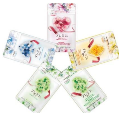
時期別の葉酸サプリメント『プレミン』シリーズ