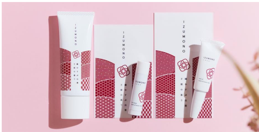
『IZUMONO』（左から）ハンドクリーム、リップクリーム、ネイルオイル

時期別の葉酸サプリの販売を行うゲンナイ製薬株式会社（本社：東京都千代田区、代表取締役社長：上山永生）は、「縁をむすぶ」をテーマにしたハンド&リップケアコスメ『IZUMONO（いずもの）』を、2019年6月3日に自社オンラインショップで発売します。ハンドクリーム、ネイルオイル、リップクリームの3点で、いずれも「縁結びの国」とされる出雲産のバラ成分を配合していることが特長です。