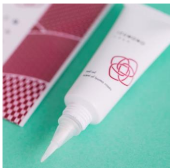
はけ一体型のネイルオイル

『IZUMONO』は「縁をむすぶ」だけでなく、品質にもこだわっています。例えば、シリーズ中ではもっとも広範囲に塗るハンドクリームや、飲食時に気になる可能性の高いリップクリームは、ローズの香りが強くなりすぎないように吟味を重ね、ローズウォーターを絶妙なバランスで配合しています。また、ネイルオイルは、液だれしにくいとろみ具合を追求するだけでなく、パッケージはチューブとはけを一体化し外出先などでも手軽に塗りやすいよう工夫しています。