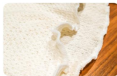
体を締め付けないフリル状のふち

春は薄着になる季節ですが、一日の中でも寒暖差が激しいうえ、急に肌寒い日が戻るなど、「花冷え」という言葉があるほどに気候が不安定です。当社は、妊活中・妊娠中の身体をサポートする葉酸サプリメント等を販売しており、製品を購入したお客様から「季節に関係なく、できる限りおなかはいつも温めておきたい」「暖かい季節は、厚手ではない腹巻きを使いたい」との声があったことから、春向けの腹巻きを発売することになりました。