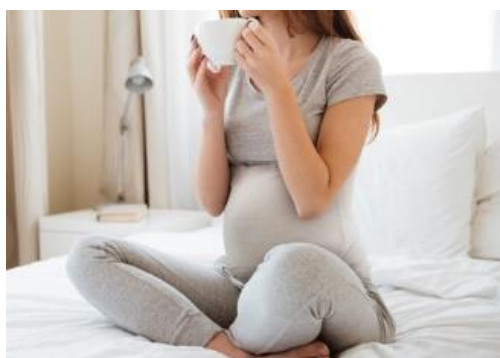
やわらかいメッシュ編みのオーガニックコットン