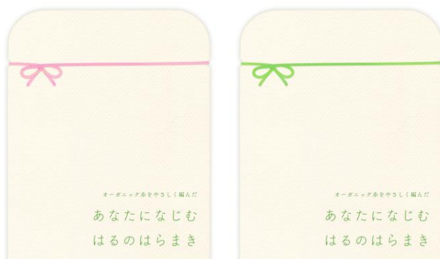
パッケージのリボンは春らしいピンクとグリーンの2種

時期別の葉酸サプリの販売を行うゲンナイ製薬株式会社（本社：東京都千代田区、代表取締役社長：上山永生）は、オーガニックコットンを使用した薄手の春用腹巻き『あなたになじむ はるのはらまき』を2019年3月29日に発売します。