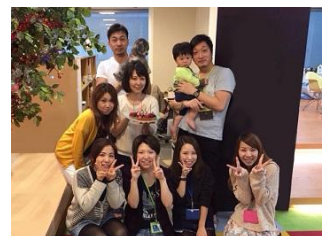
ケーキをリクエストできる誕生会