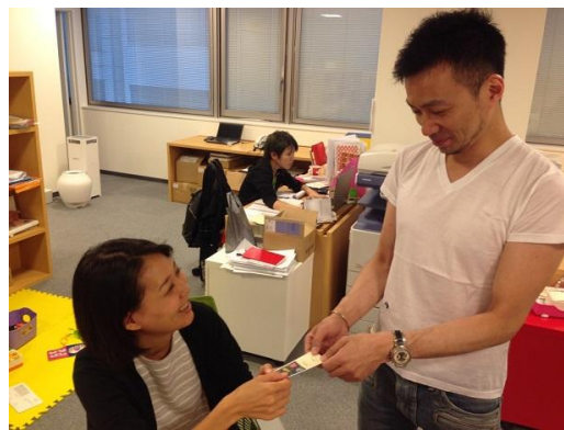
感謝の気持ちを、オリジナルカードに書いて手渡し