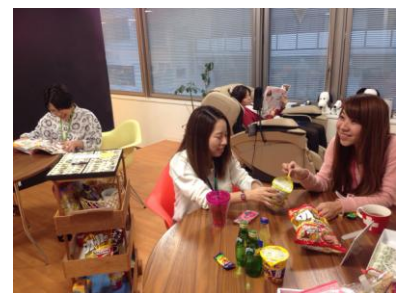
休憩時には、きっちり休みます