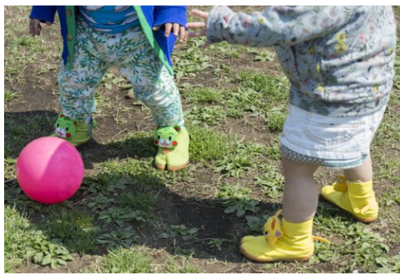
子供の足の骨は柔らかく未完成。この時期の履物選びが重要